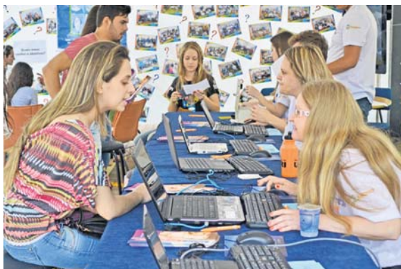
Diversos alunos aproveitaram a visita para realizar a inscrição para o vestibular de verão, que acontece no dia 23 de novembro

cerca de 500 pessoas, entre professores, funcionários e acadêmicos de 21 cursos prepararam atrativos especiais para apresentar aos discentes os conteúdos estudados durante a graduação. Com estandes espalhados por boa parte do campus, docentes e universitários da URI/FW prestaram informações aos estudantes do ensino médio de maneira prática e dinâmica.