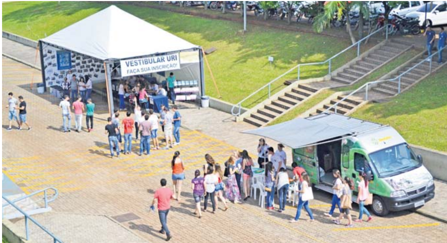
O campus da URI/FW ficou tomado por estudantes do ensino médio de toda a região