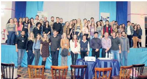
Dezenas de pessoas participaram da palestra que marcou a abertura dos preparativos para o Taller Vertical e integrou a programação da URICOM