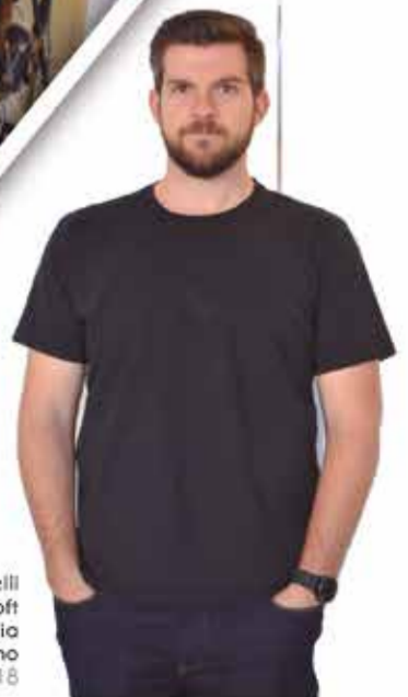
Marcos Basso Ottonelli Ambiente: Loft Conceito: Um novo estilo de moradia Estilo: Moderno Praça: 15/05/2018 a 04/06/2018

IMPERATRIZ RUA JOSÉ CAPELARI, Nº 1111 - CENTRO - FREDERICO WESTPHALEN-RS | 55 3744-4890