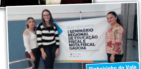
Pinheiro do Vale