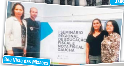
Boa Vista das Missões