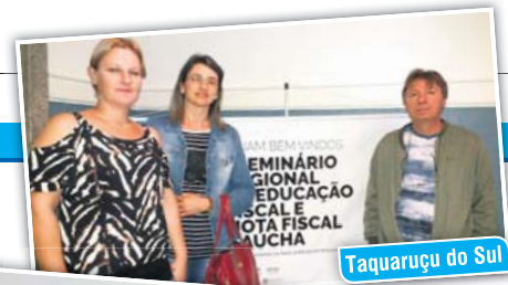
Taquaruçu do Sul

Além do município anfitrião, marcaram presença no evento Grupos de Educação Fiscal de Alpestre, Boa Vista das Missões, Cristal do Sul, Dois Irmãos das Missões, Iraí, Jaboticaba, Palmitinho, Rodeio Bonito, Taquaruçu do Sul, Vicente Dutra, Vista Alegre, dentre outros. Além da qualificação na área, a participação dos grupos no seminário gera pontuação para os municípios no PIT.