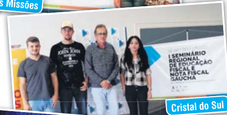
Cristal do Sul