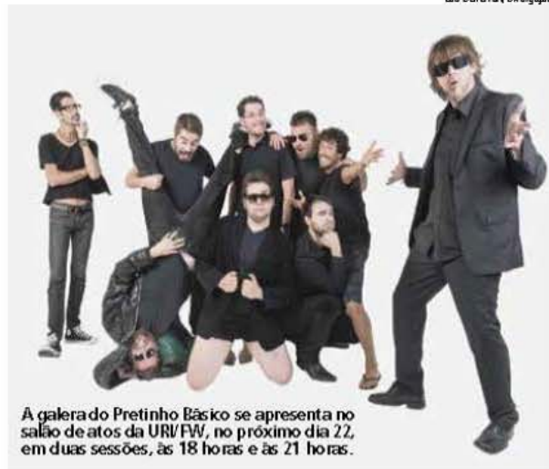
A galera do Pretinho Básico se apresenta no salão de atos da URU/FW, no próximo dia 22, em duas sessões, às 18 horas e às 21 horas.